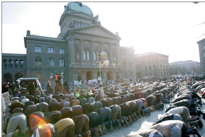
11.02.2006: Des musulmans manifestent devant le Palais fédéral. Ils réclament une restriction de la liberté d'expression «par égard aux musulmans» (après l'affaire des caricatures au Danemark).

Le Constitution fédérale suisse protège la liberté de conscience et de croyance (art. 15 cst.).